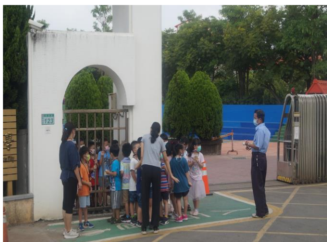
說明：一年級路隊訓練