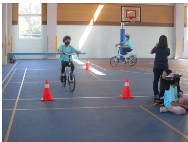
說明：五年級自行車檢定