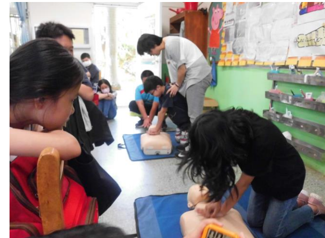
說明：六年級簡易急救訓練