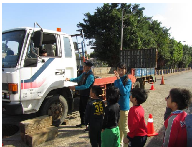
說明：三年級內輪差教學